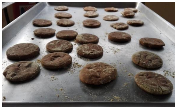
Imagen 5. Masas de pizzas pre cocidas en horno a Gas