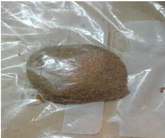
Imagen 3. Masa de pizza (P2) en funda plástica