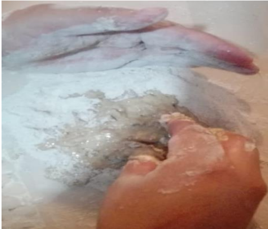
Imagen 1. Amasado

oscuro, en la reacción de Maillard ocurre a partir de la interacción de las proteínas aminoras con los carbohidratos (Ureta, 2015), este efecto se observó en las masas, ya que el color se intensificó, tomando una coloración rojiza. Finalmente, se obtuvo como resultado final masas de pizza, las cuales fueron almacenadas en fundas ziploc aluminizadas en congelación a una temperatura aproximada de -2.2^{\circ}\text{C} .