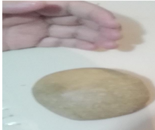
Imagen 2. Masa de pizza (P1)