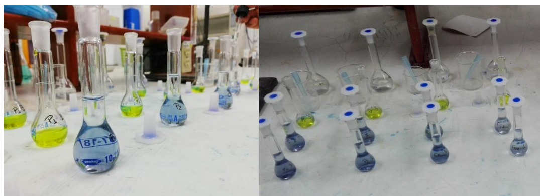
Figura 1. Desarrollo del Método Folin-Ciocalteu.

Finalmente, las lecturas se realizaron por duplicado en un espectrofotómetro UV/vis (Boeckel Co S-220) a una longitud de onda de 765 nm. La curva de calibración fue preparada con un patrón de ácido gálico con diluciones de 0.1, 2.5, 5.0, 7.5, 10, y 15 ppm. Se cuantificó la concentración de polifenoles totales, interpolando en la curva de calibración de ácido gálico, usando el promedio de las absorbancias obtenidas para cada muestra de estudio.