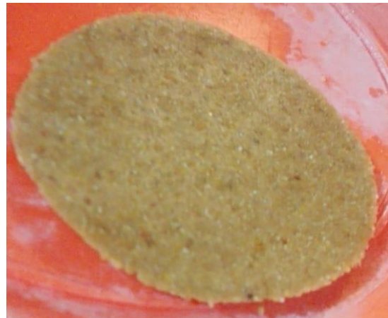
Imagen 4. Laminado pizza (P1)