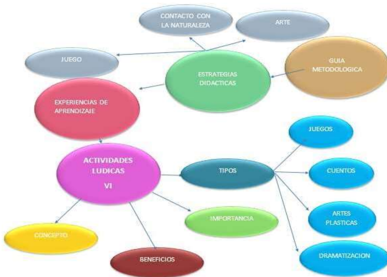
Figura N.º 2 Constelación de ideas