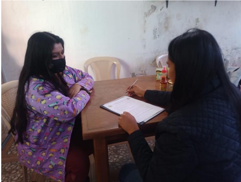
Imagen3: Entrevistada 3 (10/12/2021)