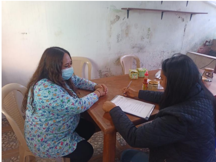
Imagen4: Entrevistada 4 (10/12/2021)