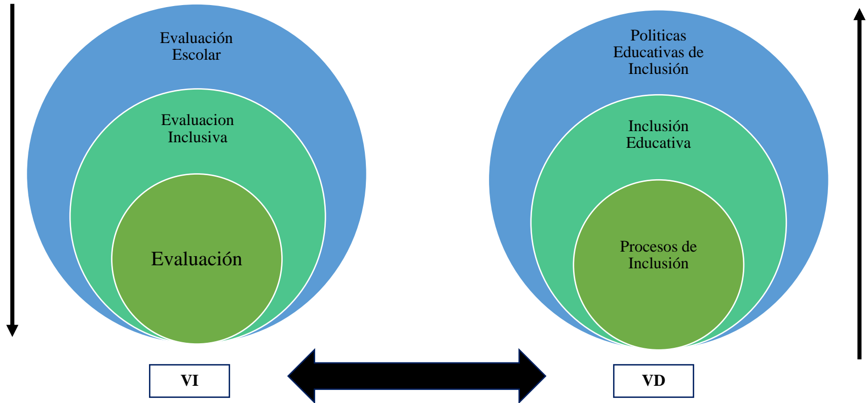
Gráfico1: Red de Inclusión Elaborado por: Estefanía Lozada