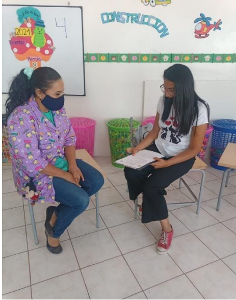
Autora: Estefania Lozada Fuente: Entrevista