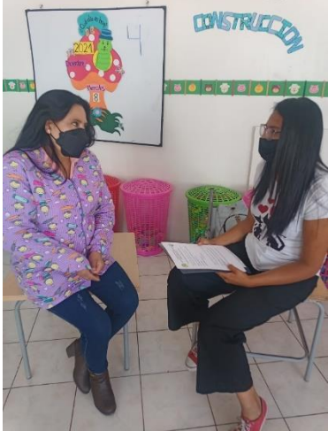
Autora: Estefania Lozada Fuente: Entrevista