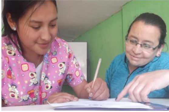
Imagen 4. Entrevista Docente 4