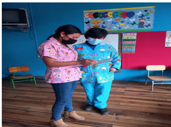
Imagen 1. Entrevista Docente 1