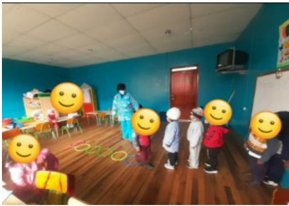
Imagen 5. Juego del hula