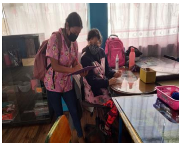
Imagen 2. Entrevista Docente 2