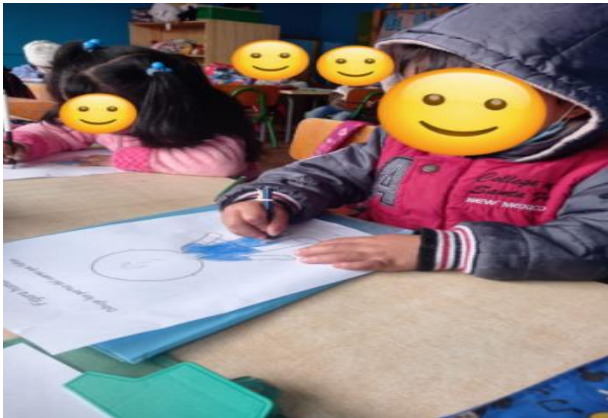
Imagen 6. Clase Mi Cuerpito