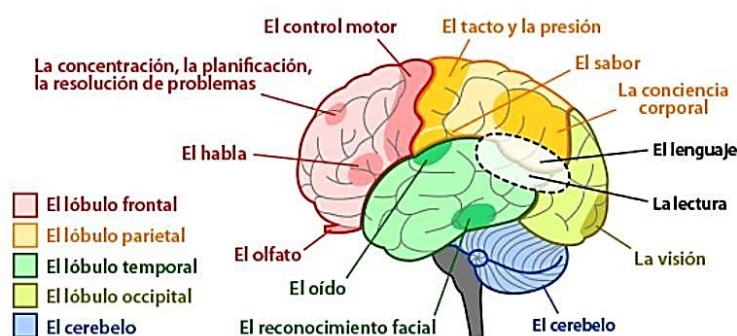
Figura 1. Asociación lenguaje-cerebro

Nota. La figura muestra la asociación del lenguaje en el cerebro.