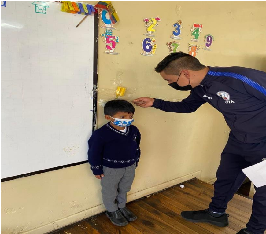
GRAFICO 4 INTERVENCION