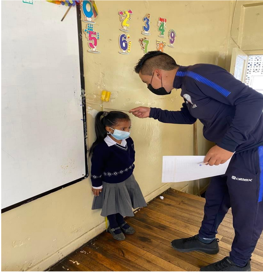
GRAFICO 8 INTERVENCION