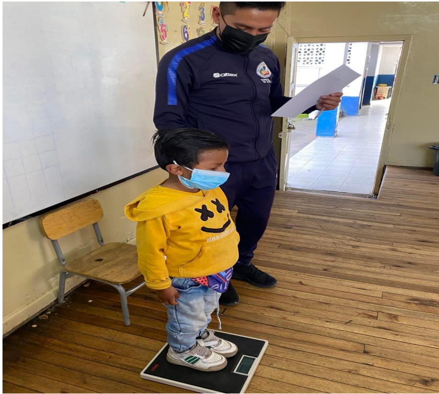
GRAFICO 6 INTERVENCION