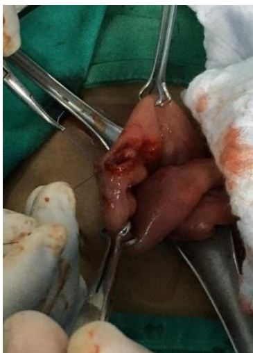
Figura 3. Enterotomía.

Paciente con criterios abdomen agudo quirúrgico de emergencia, por lo que se decide realizar laparotomía. Se realiza intervención quirúrgica encontrándose líquido inflamatorio libre de aproximadamente 350 mililitros, apéndice de 12 por 0,6 centímetros, congestivo y eritematoso, mucosa no comprometida; aproximadamente a un metro de válvula ileocecal se evidencia asa intestinal dilatada 4 veces su tamaño normal, contenida en su totalidad por parásitos (áscaris lumbricoides) por tanto se realiza enterotomía (Figura 3.) de aproximadamente 20% su extensión para extracción de parásitos más devaneo peristáltico y antiperistáltico hacia enterotomía extrayendo parásitos residuales, además se evidencia parásitos difusos a lo largo de todo el intestino delgado, finalmente se realiza anastomosis primaria. (Figura 4.) Paciente en tratamiento post quirúrgico con analgesia, antibioticoterapia a base de Ampicila más Sulbactám cada 6 horas por 5 días y Piperacina 1500 gramos dosis diaria por sonda nasogástrica por 3 días, paciente presenta evolución postquirúrgica favorable, canalizando flatos, con eliminación de áscaris lumbricoides por boca y nariz post administración de antiparasitarios. Se encuentra hemodinámicamente estable, herida quirúrgica sin signos de inflamación, por lo que se decide el alta médica y se envía con Albendazol 400 miligramos vía oral dosis única.