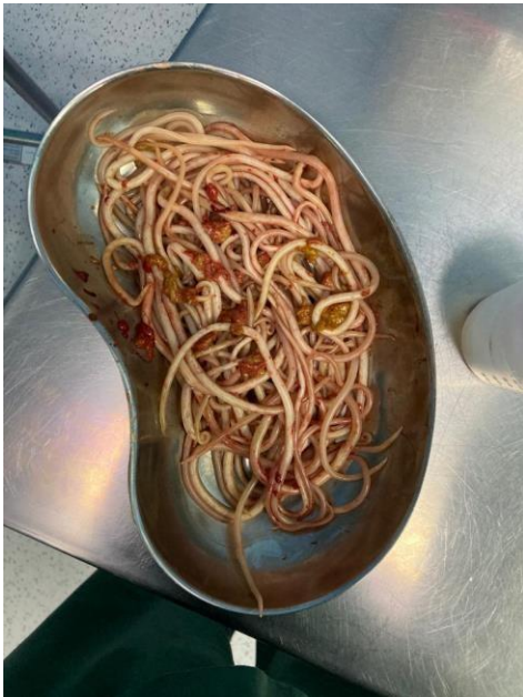
Figura 2. Ejemplares extraídos

Paciente en tratamiento post quirúrgico con analgesia, antibióticoterapia a base de Ampicilina más sulbactám 900 miligramos cada 6 horas por 7 días y con Piperacina 1,5 gramos dosis diaria por sonda nasogástrica por 3 días, Ácido ascórbico 500 miligramos intravenoso diario, paciente con favorable evolución postquirúrgica, canalizando flatos, deposiciones con evidencias de áscaris lumbricoides; hemodinámicamente estable por lo que se decide el alta médica.