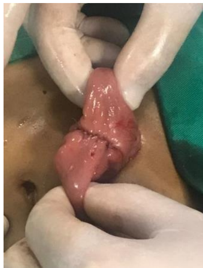
Figura 4. Anastomosis primaria.