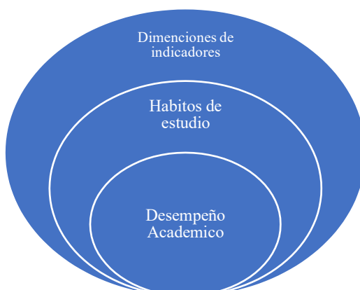
Gráfico: Desempeño Académico