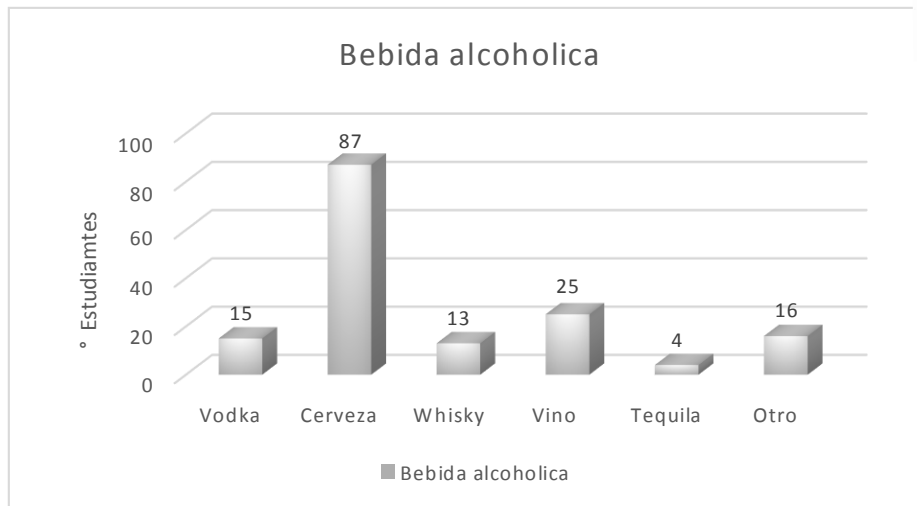
Figura 3: Tipo de bebida alcohólica.

En la gráfica se observa la frecuencia en cuanto a la bebida alcohólica que más consumen los estudiantes universitarios, siendo la cerveza la más consumida seguida del vino y otra clase de bebida que es muy popular entre los alumnos como es el Switch.