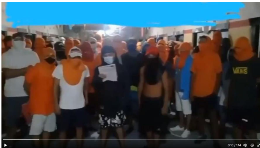
Figura 9: Discurso del grupo "Las Águilas"