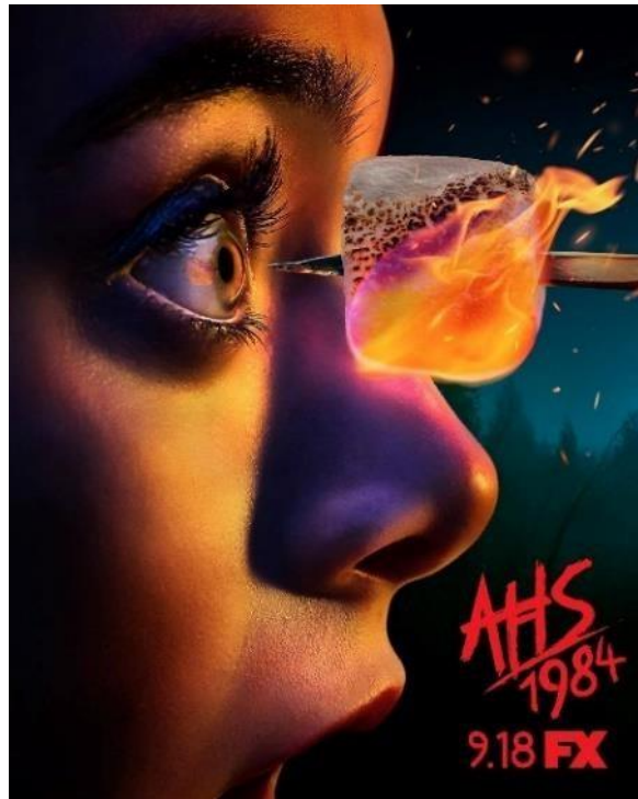
Figura 3: Portada "American Horror Story (2011)