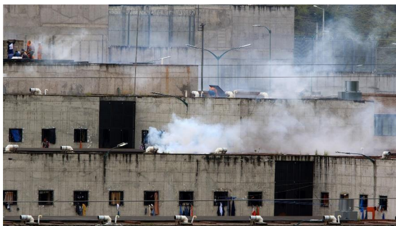
Figura 6: Cárcel del Turi el 23 de febrero del 2021