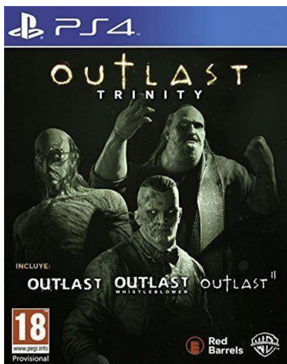
Figura 5: Portada "Outlast" (2013)