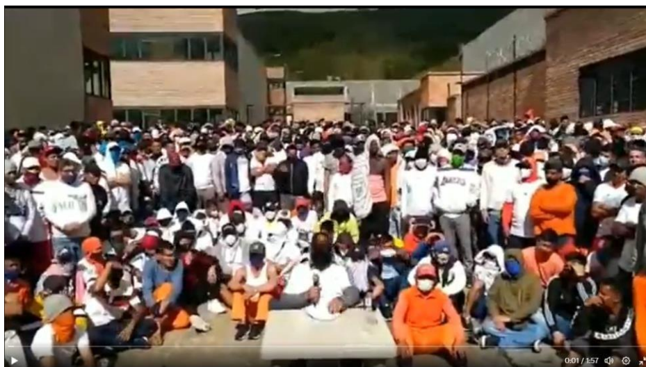
Figura 8: Discurso Cárcel de Turi