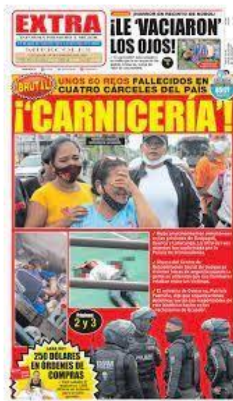
Figura 1 Portada diario El Extra del 24 de febrero del 2021