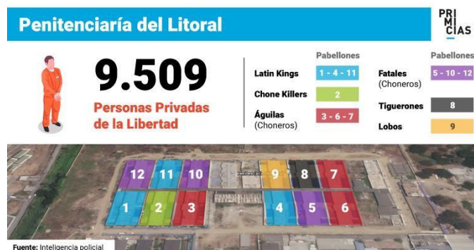
Figura 7: Distribución de las bandas en los pabellones de la Penitenciaría del Litoral