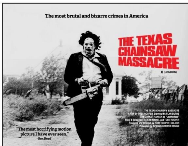
Figura 2: Portada película "The Texas Chain Saw Massacre"