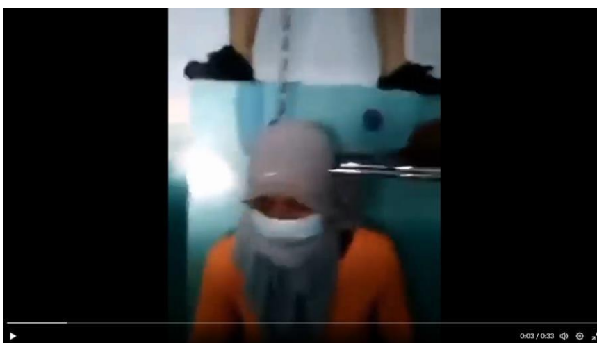
Figura 10: Fragmento del video sobre extorsión y amenazas en la cárcel