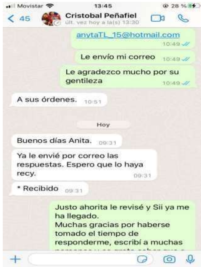
Imagen 3 Entrevista vía WhatsApp

Nota: Cristóbal Peñafiel- presidente de la UNP