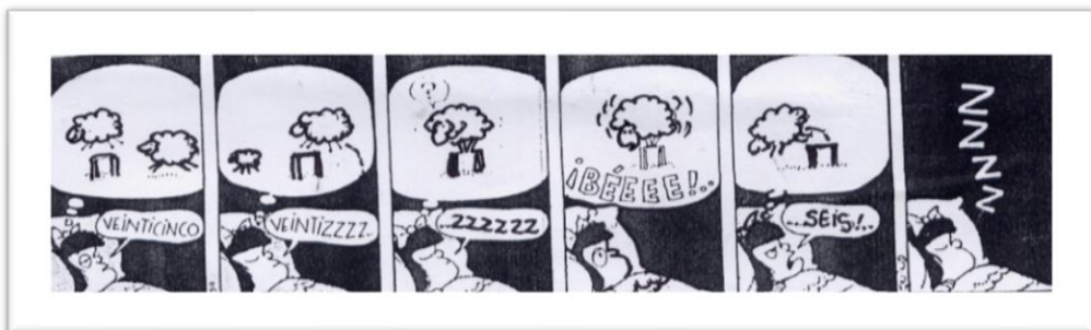
Imagen - Texto 1