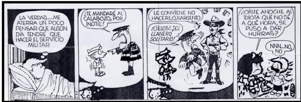
Imagen - Texto 2