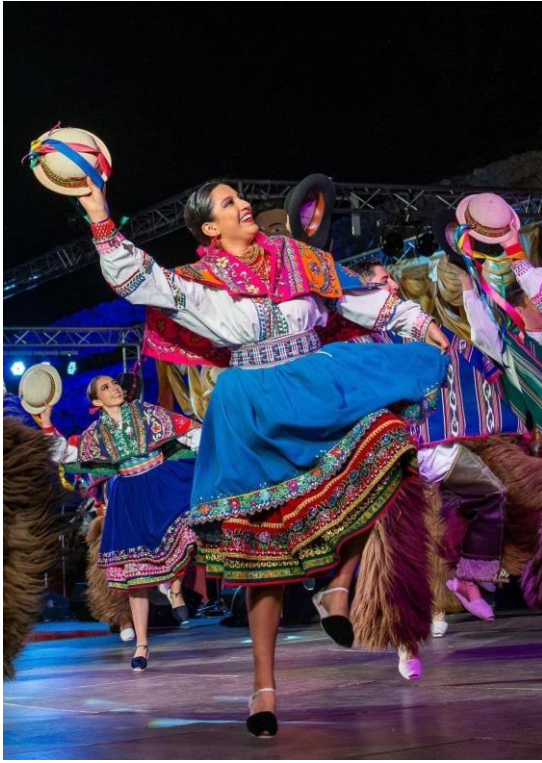
Coreografía “La Minga” Fotografía por: Juan Carlos Álvarez Ramos (2023)