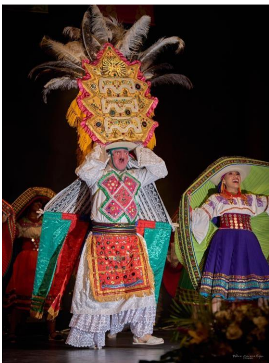
Coreografía “Danzantes” (2023)