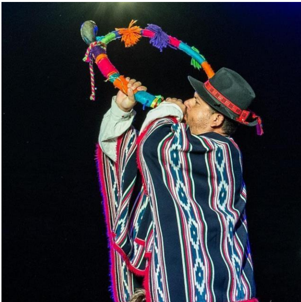
Coreografía “La Minga” Fotografía por: Juan Carlos Álvarez Ramos (2023)