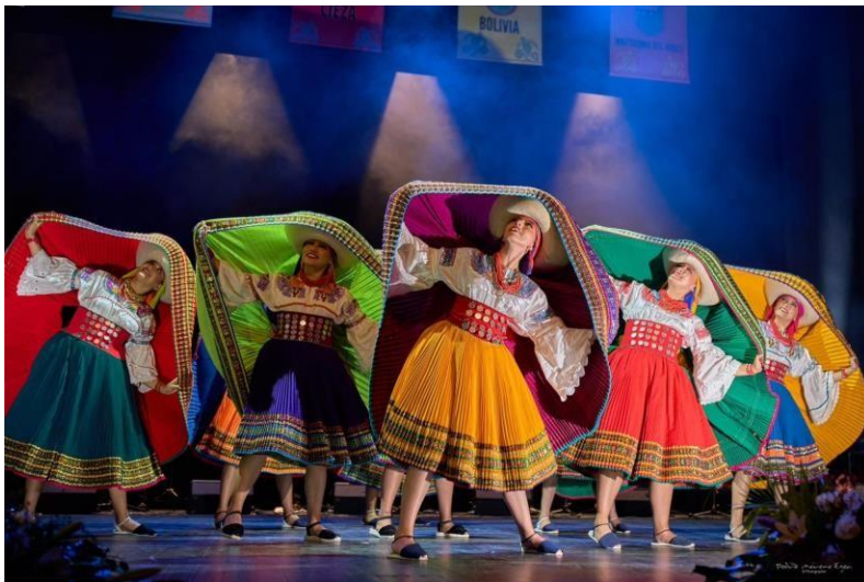
Coreografía “Ñustas” (2023)