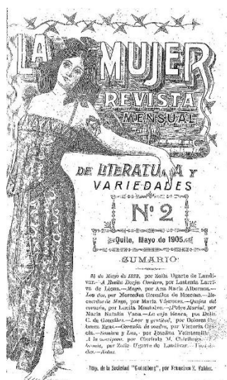
Revista "La mujer"

Nota: Primera revista femenina ecuatoriana. Portada de la revista “La mujer” publicación N° 2 en 1905.