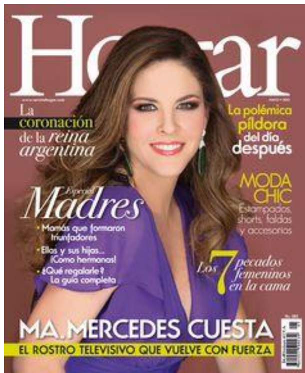
Ilustración 10 Revista Hogar - Mayo 2013