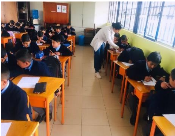
Imagen de los estudiantes de sexto grado paralelo “A” (pretest)

Nota. La imagen muestra cómo los estudiantes desarrollan un diagnóstico (pretest) para conocer sus bases teóricas sobre textos narrativos y la creatividad escrita.