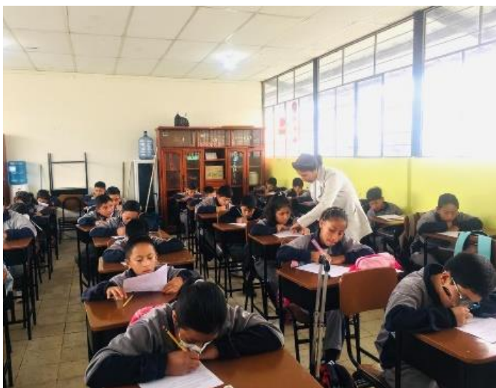
Imagen de los estudiantes de sexto grado paralelo “A” (pretest)

Nota. La imagen muestra cómo los estudiantes desarrollan un diagnóstico (pretest) para conocer sus bases teóricas sobre textos narrativos y la creatividad escrita.