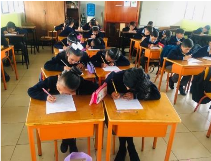
Imagen de los estudiantes de sexto grado paralelo “A” (post test)

Nota. La imagen muestra el instante en que los estudiantes desarrollan el post test, luego de la intervención docente.