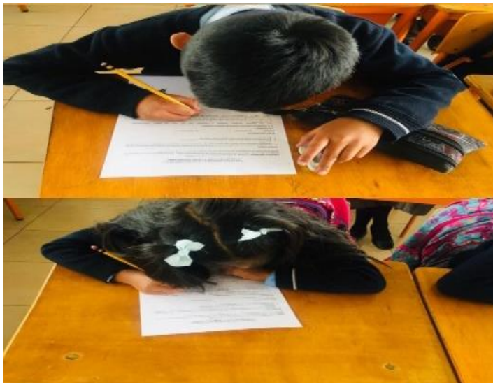
Imagen de los estudiantes de sexto grado paralelo “A” (post test)

Nota. La imagen muestra el instante en que los estudiantes desarrollan el post test, luego de la intervención docente.